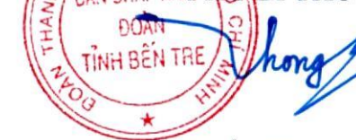
Võ Tuấn Thông